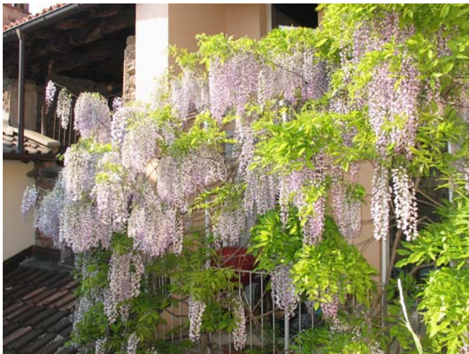
Innenhofbalkon im Frühling